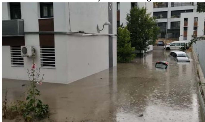
Barrio del Aeropuerto. Inundado 29-mayo

Durante las tormentas de la última semana de mayo, y especialmente el día 29, se han vuelto a producir inundaciones en los aparcamientos subterráneos de la C/ Pinos de Osuna y c/ Balandro y también en el Barrio de Aeropuerto con zonas en las que se ha alcanzado más de metro y medio de agua.